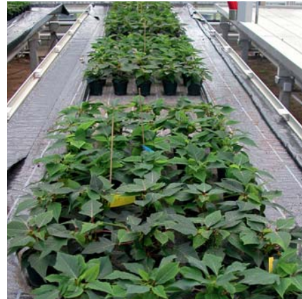
Poinsettien mit Brakteen ohne NovaTec® 18 fluid (NPK-Nährsalz 18+12+18) Kulturentwicklung am 09.11.2010