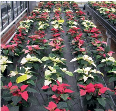
Poinsettien mit Brakteen Düngung mit NovaTec® 18 fluid und Hakaphos basis 5 Kulturentwicklung am 09.11.2010