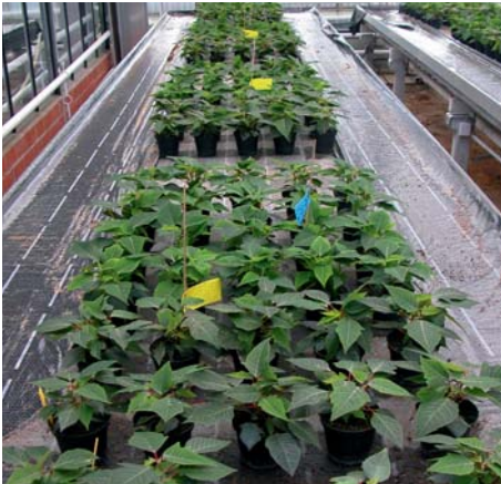
Poinsettien mit Brakteen Düngung mit NovaTec® 18 fluid und Hakaphos basis 5 Kulturentwicklung am 29.09.2010