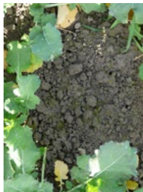
Saubere Felder mit Colzor Trio