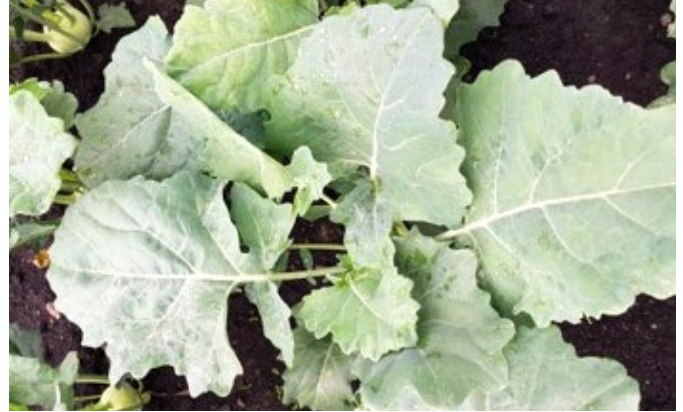
Kohlpflanze der gleichen Kultur nach Behandlung mit 2 l/ha Bioforge.