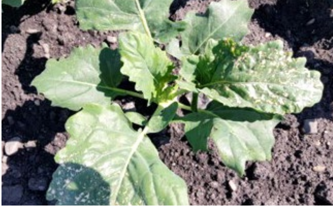
Kohlpflanze mit beschädigten Blättern.

Bioforge optimiert das hormonelle System der Pflanzen und fördert die Erholung nach Stressereignissen. Das hilft den Pflanzen, extreme Temperaturen und Trockenheit zu überstehen. Bei plötzlich auftretenden Situationen wie Hagel oder Frost stärkt Bioforge den Stoffwechsel der Pflanzen und reaktiviert das Wachstum.