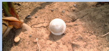
Die praktische TrichoKugel Omya

Die TrichoKugeln Omya bestehen aus einem biologisch abbaubaren Werkstoff aus nachwachsenden Rohstoffen. Sie bleiben einige Wochen formstabil und bieten daher einen idealen Schutz vor Regen und räuberischen Insekten.