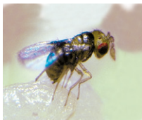
Ein Trichogramma-Weibchen bei der Ablage eines Eis in das Ei des Maiszünslers.

Das Weibchen der Trichogrammen legt seine Eier in die vom Maiszünsler abgelegten Eier. Aus den parasitierten Maiszünslereiern schlüpfen dann anstatt des Maiszünslers nach 9–12 Tagen die nächste Generation der Trichogrammen. Die Maiszünslerpopulation verbleibt so nachhaltig auf einem niedrigen Niveau.