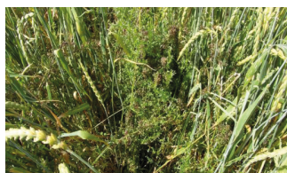
Gaillet gratteron dans une culture de blé

Pixxaro EC est très puissant contre les gaillets de toutes tailles et montre une efficacité rapide et sans faille indépendamment de la température. A cela s'ajoutent un large spectre d'efficacité, une grande souplesse d'utilisation (jusqu'au stade BBCH 45) et une excellente sélectivité dans les céréales d'hiver et de printemps (excepté l'avoine).