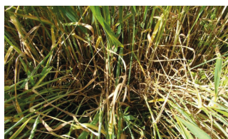
Succès du traitement avec Pixxaro EC